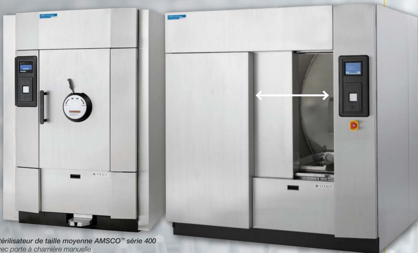
Stérilisateur de taille moyenne AMSCO™ série 400 avec porte à charnière manuelle (660 x 950 mm)